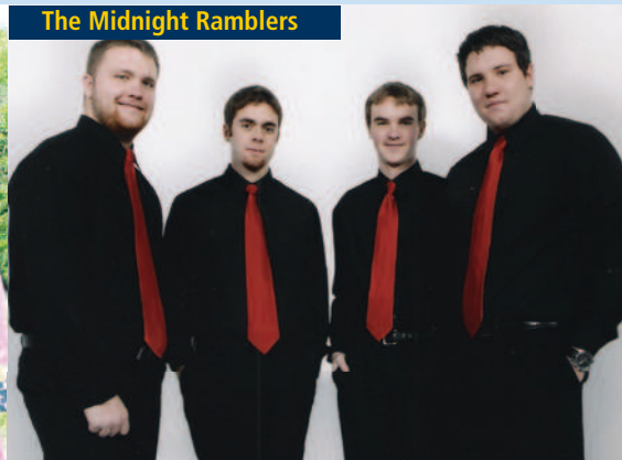
The Midnight Ramblers