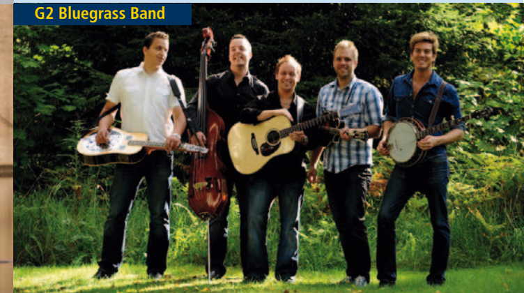
G2 Bluegrass Band