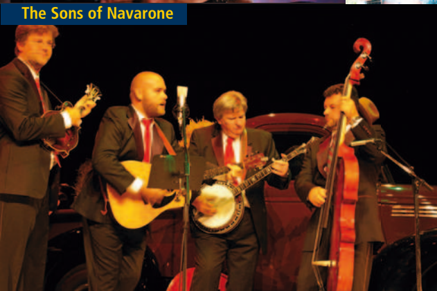
The Sons of Navarone